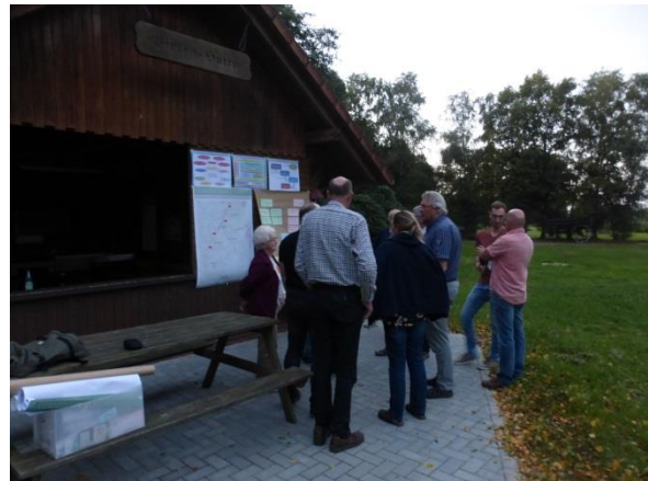
DorfbewohnerInnen begutachten die dokumentierten Ergebnisse des Dorfgesprächs